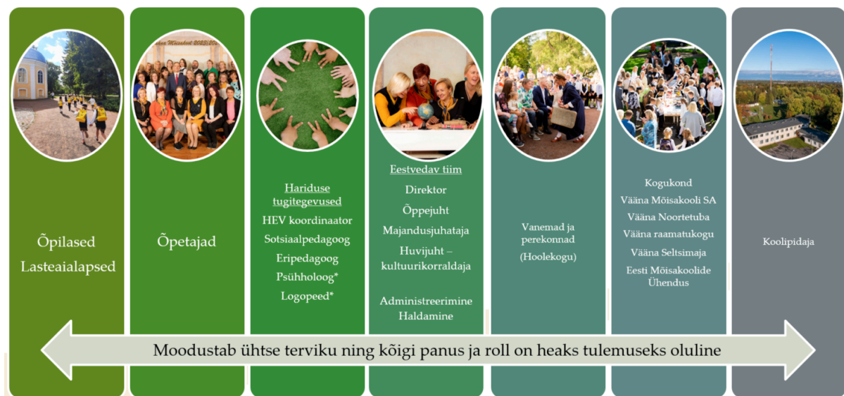
Joonis 2. Väina Möisakooli kooli- ja lasteaiapere

Meie kooli- ja lasteaiapere liikmeskonnana näeme laiemat kaasatust, kuhu kuuluvad lisaks õpilastele ja töötajaskonnale vanemad, kogukond ja seotud osapooled ning koolipidaja. Püüdleme eesmärgi poole, et antud liikmeskond moodustaks ühtse terviku, sest kõigi osapoolte panus ja roll on tulemuslikuks õppimiseks ja kasvamiseks oluline.