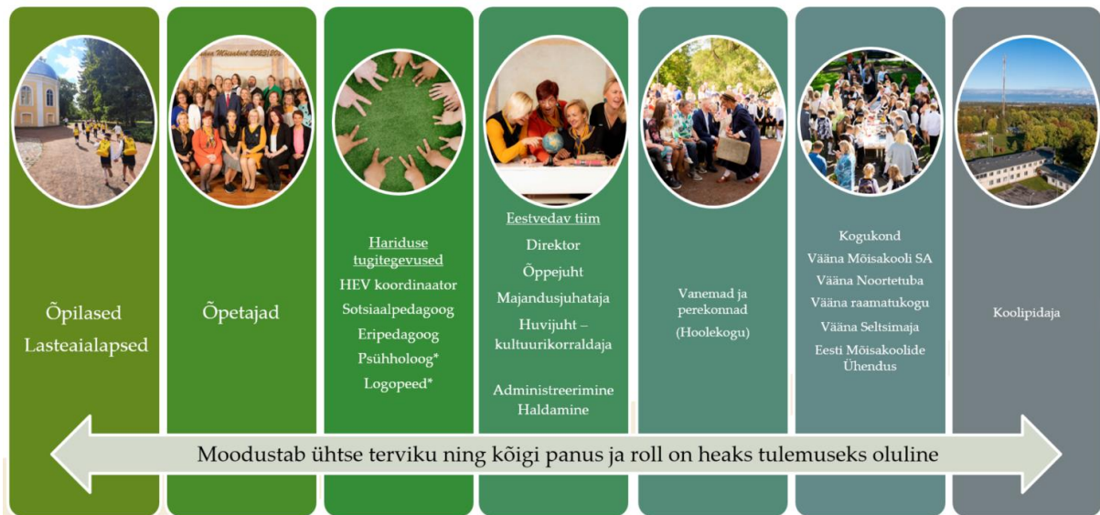
Joonis 2. Väina Möisakooli kooli- ja lasteaiapere

Meie kooli- ja lasteaiapere liikmeskonnana näeme laiemat kaasatust, kuhu kuuluvad lisaks õpilastele ja töötajaskonnale vanemad, kogukond ja seotud osapooled ning koolipidaja. Püüdleme eesmärgi poole, et antud liikmeskond moodustaks ühtse terviku, sest kõigi osapoolte panus ja roll on tulemuslikuks õppimiseks ja kasvamiseks oluline.